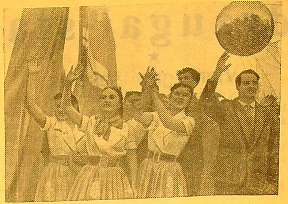
VIENA. VII Pasaulinis jaunimo ir studentų festivalis. Tarybinė delegacija Vienos stadione.