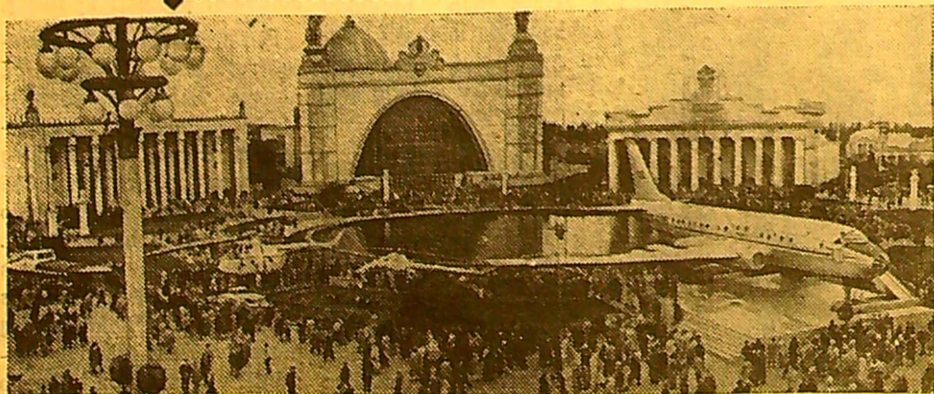
MASKVA. TSRS Liaudies ūkio laimėjimų paroda.