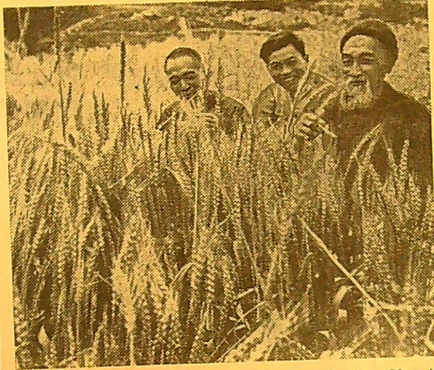
KINIJOS LIAUDIES RESPUBLIKA. Si-čuan provincijos Inšan apskrityje liaudies komunoje Čenu bręsta gausūs kviečių derlius.