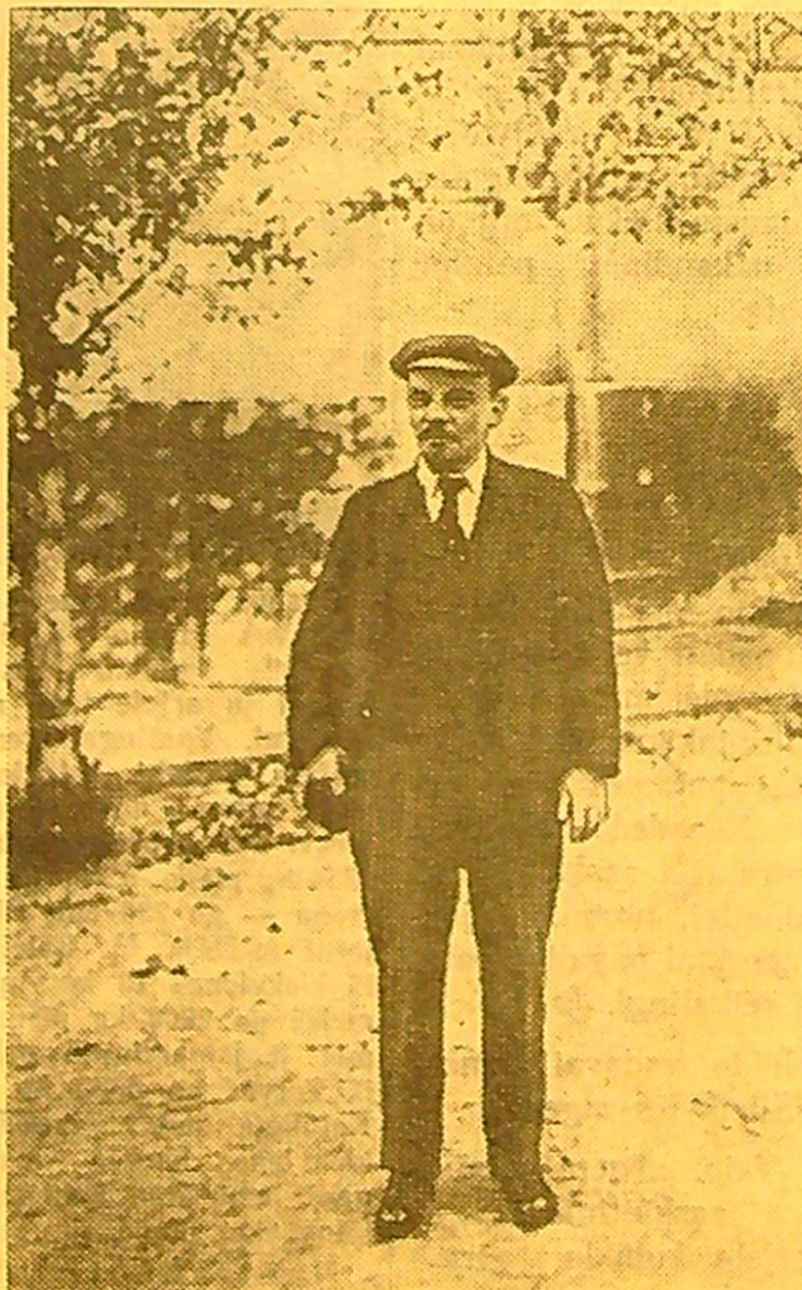
V. Leninas Kremliaus kieme pirmąkart pasivaikšto po sužeidimo (1918 m.).

Netrukus prie Petrašiūnų išsilies jūra, o Spalio švenčių išvakarėse Nemuno vandenys pradės sukti pir-