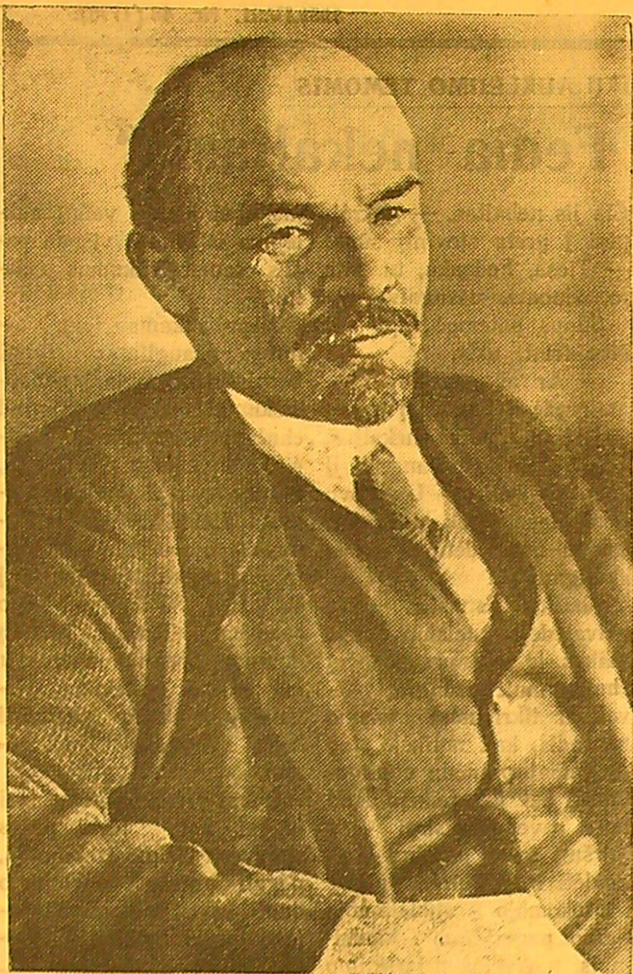
V. LENINAS. (1918 m. sausis).