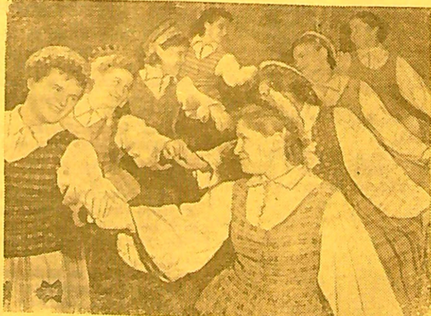
Nuotraukoje: kultūros namų liaudies šokių ratelis atlieka „Audėjėle“.