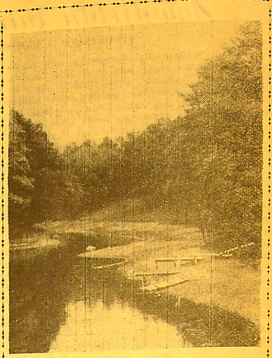
Buvo sausa vasara...

Apipildymo metu vagys išbrovė į paveikslų galeriją ir išpiovė drobės taip, kad rėmuose liko 1,5–3 centimetrų pločio juostelės. Taip sugadinę paveikslus, jie nesiryžo pasiūlyti savo grobio perpirkėjams ir numetė paveikslus garaže. Dabar restauruotojai atkuria išdarytus paveikslus.