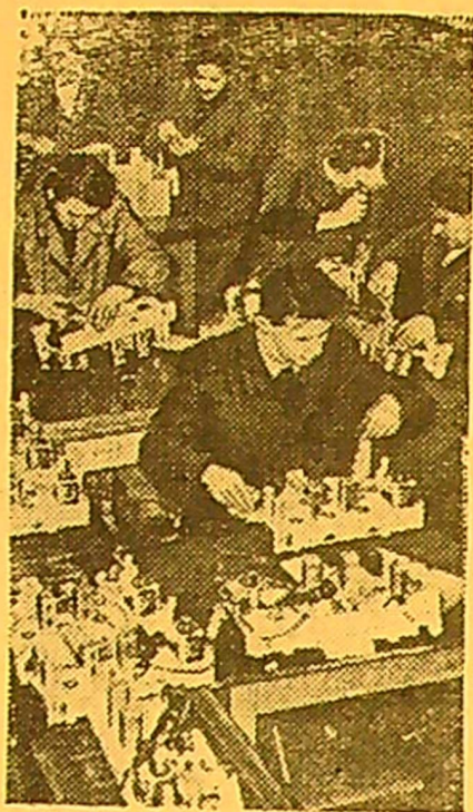
LENKIJOS LIAUDIES RESPUBLIKA. Varšuvos Kaspšako vardo radio fabriko darbininkai įvyksiančio Lenkijos Jungtinės Darbininkų partijos III suvažiavimo garbei prisiėmė išpareigojimus pagaminti virš plano tūkstančius naujos konstrukcijos radio priimtuvų. Nuotraukoje: fabriko ceche.