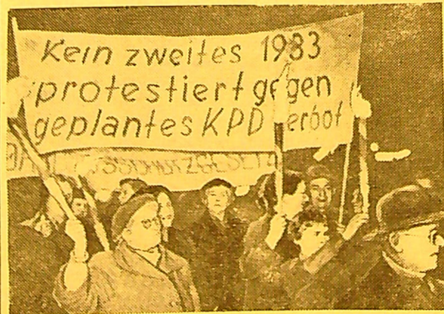
VOKIETIJOS FEDERALINĖ RESPUBLIKA.

Bremeno miesto gyventojų protesto demonstracija prieš karinės prievolės įvedimą ir VKP uždraudimą.