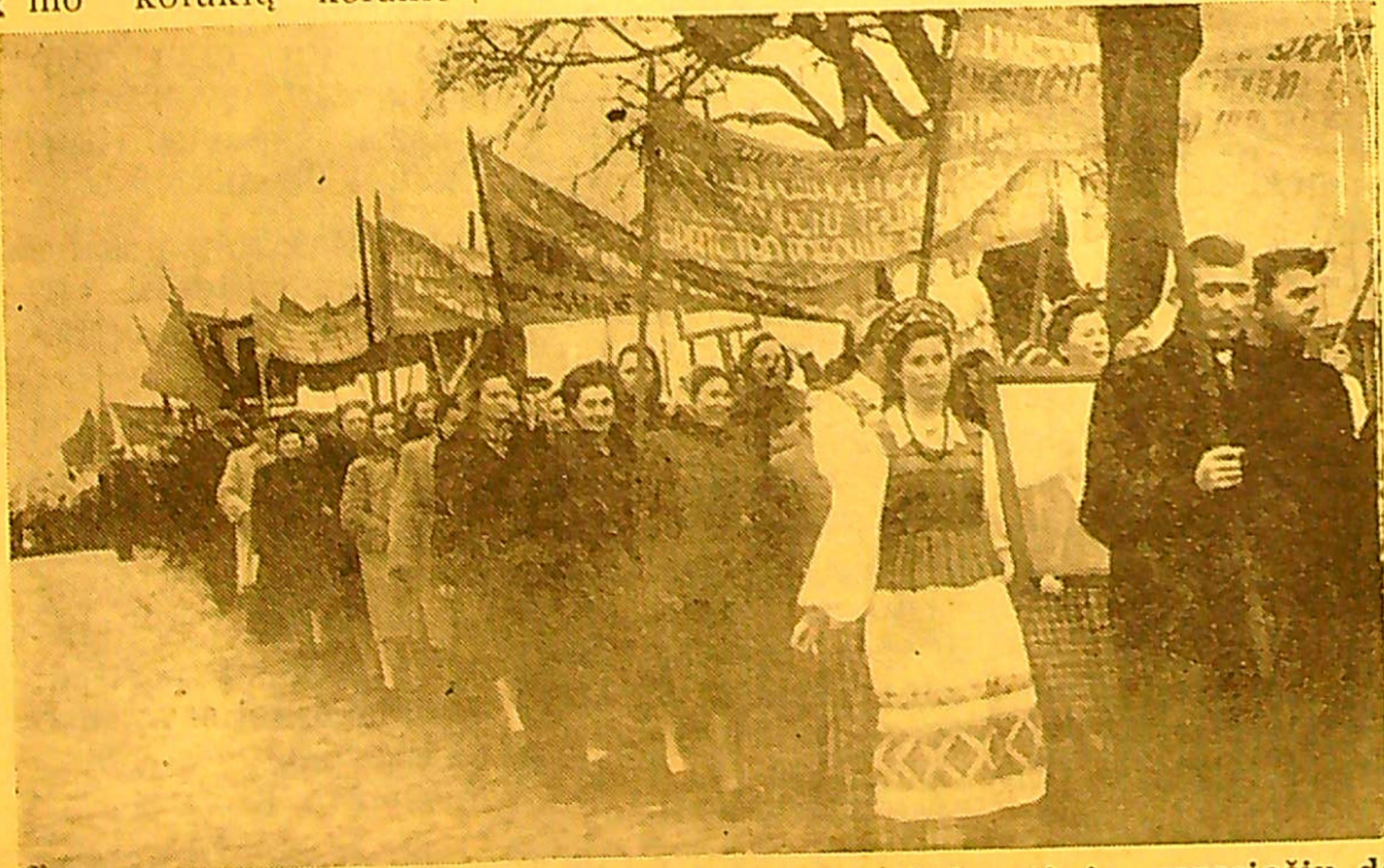
Nuotraukose: vaizdai iš šventinės zarasiečių demonstracijos.