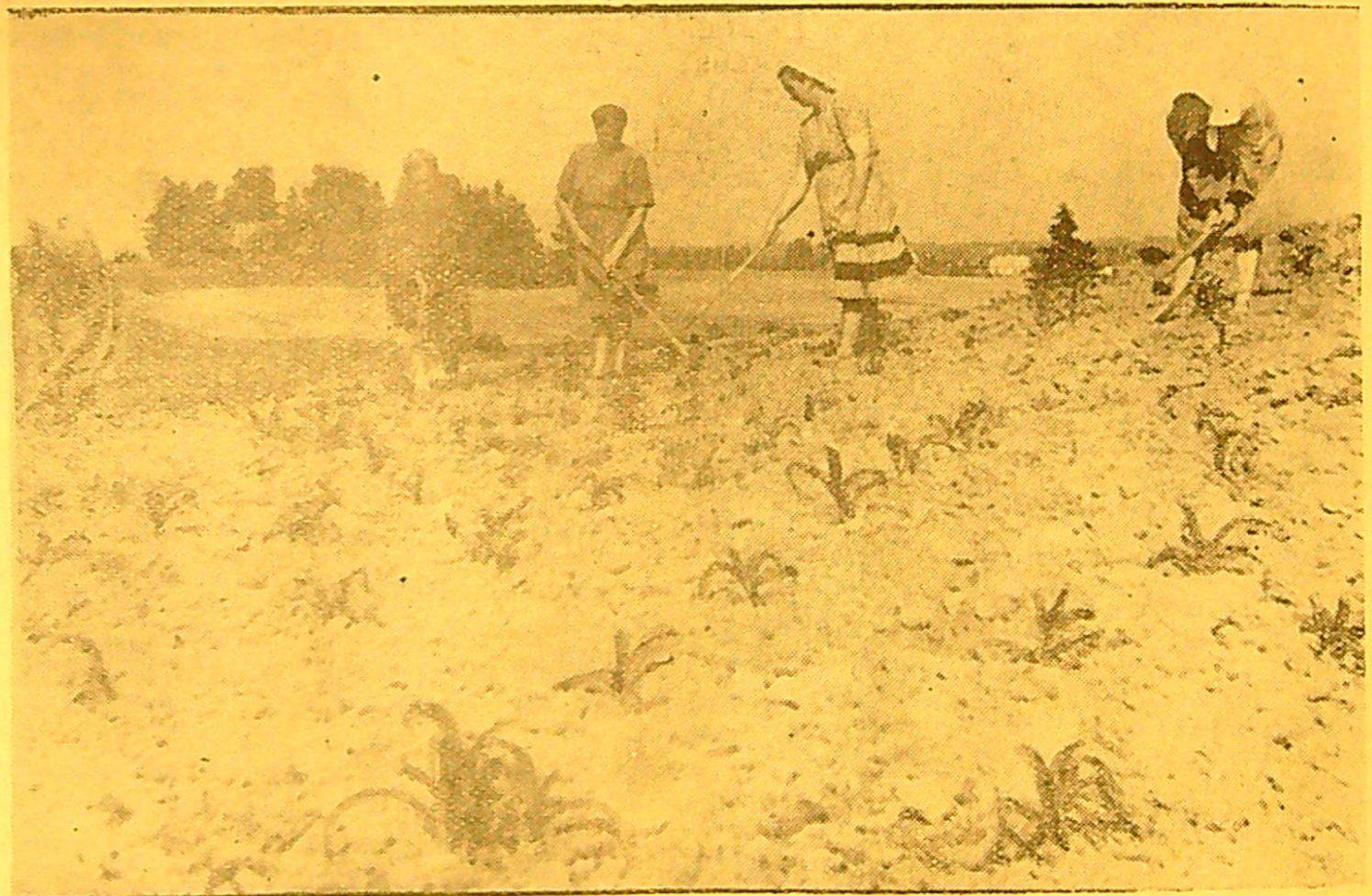
NUOTRAUKOJE: kukurūzų lauke.

P. Cvirkos vardo kolūkio I laukininkystės brigados kolūkiečiai