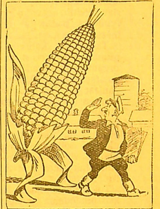
Kukurūzai—kam čia jų? Geriau miežių, avižių. Kuzmino pieš.