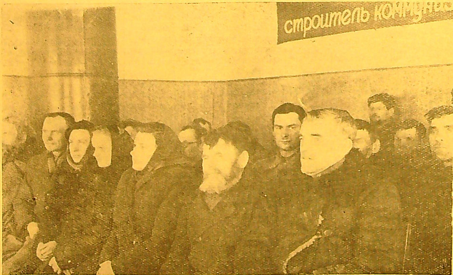
Bendras susirinkimo vaizdas.

Pas mus žemas ir avių produktyvumas — maža prikerpama vilnos ir avių įmittimas blogas. Tai yra todėl, kad nesirūpinama išskirti geras ganyklas, gtrydklas. Avys daugiausia ganosi pelkėse ir drėgnose plevose, geria blogą vandinį. Tai trukdo priaugti augimą, sumažina avių įmittimą ir neigiamai veikia į jų sveikatą. Avių ganykloms reikia išskirti geras, sausas dirvas, pageidautina — dirvonus, organizuoti užtvartinę ganymo sistemą, aprūpinti avis gerais pašarais žiemos laikotarpiu.