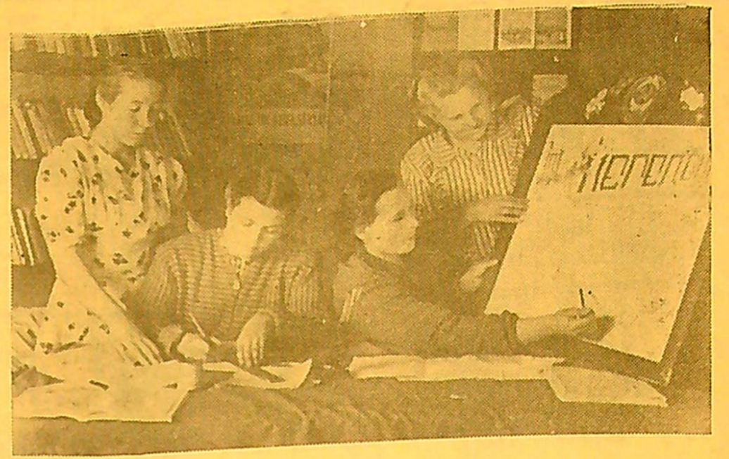
Reguliariai išėina „Garbingo darbo“ kolūkyje sieninis laikraštis „Peredovik“.

Tokiu būdu ir dirvos struktūros pagerinimo uždavinys lengvai ir sėkmingai išsprendžiamas įvedus keturių laukų sėjomainą. Be to, esant šiai sėjomainai sudaromos palankios sąlygos augti tokiai pajamingai ir svarbiai techninei kultūrai, kaip linai. Laiku ir tinkamai atlikus linų priežiūros darbus, esant keturių laukų sėjomainai, jie gali duoti kolūkiui pusę visų gaunamų pajamų.