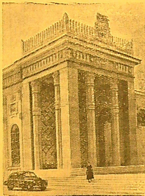
MASKVA. Visasąjunginė žemės ūkio paroda. Paviljonas „Estijos TSR“.