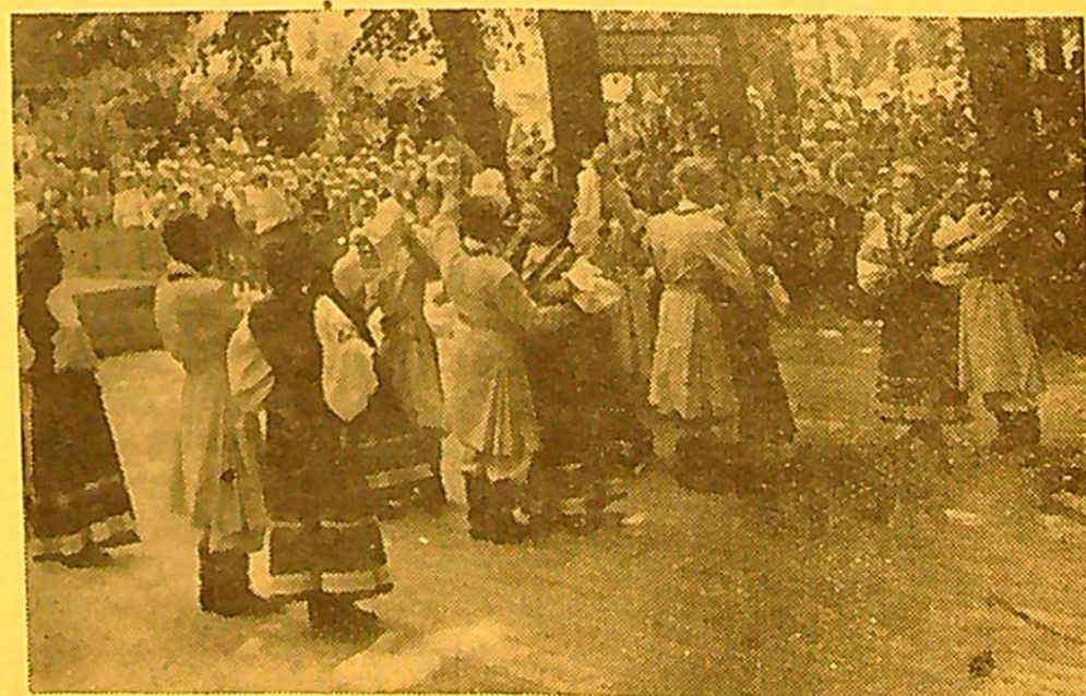
Nuotraukoje: Latvijos TSR Daugpilio miesto Kultūros namų meninės savišveikos kolektyvas atlieka šokį „Muškadrilis“.