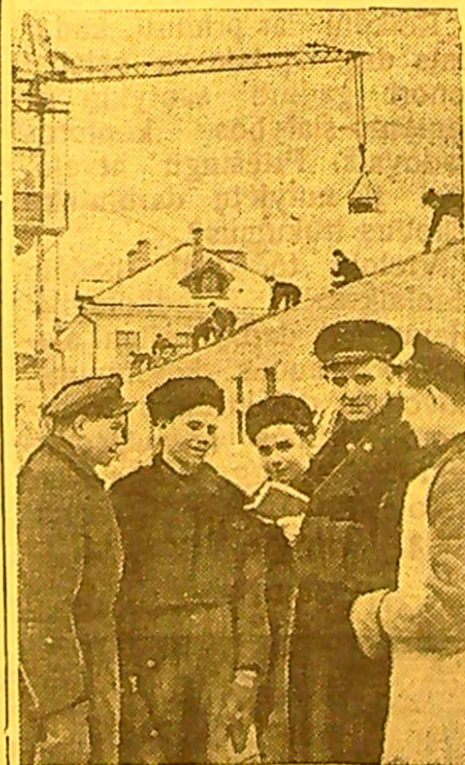
Radviliškio stoties geležinkelininkams statomi du gyvenamieji namai.

Kolūkiams įsisavinant naujas žemes ir išplėčiant pasėliu plotus didelę pagalbą suteiks Pasvalio MTS. Mechanizatoriai šiais metais 300 hektarų plotą apvalys nuo krūmų ir akmenų.