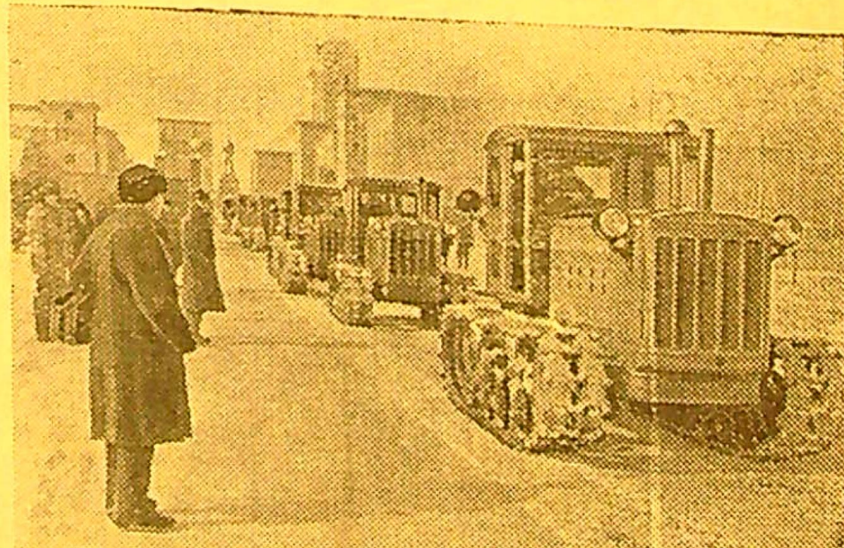
Kasdien iš Altajaus M. I. Kalinino vardo traktorių gamyklos pakrovimo aikštelės išsiunčiami į MTS traktoriai „DT—54“ dirvonams ir plėšiniams suarti.

Nuotraukoje: traktoriai „DT—54“ išsiunčiami į Volčichino rajono Gorkio MTS.