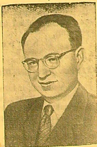
Hovardas Fastas — rašytojas (JAV).