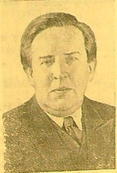
Džonas Bernalas — Londono universiteto profesorius (Anglija).