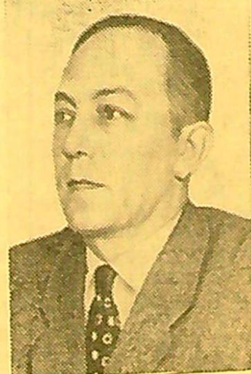
Leonas Kručkovskis — rašytojas (Lenkija).