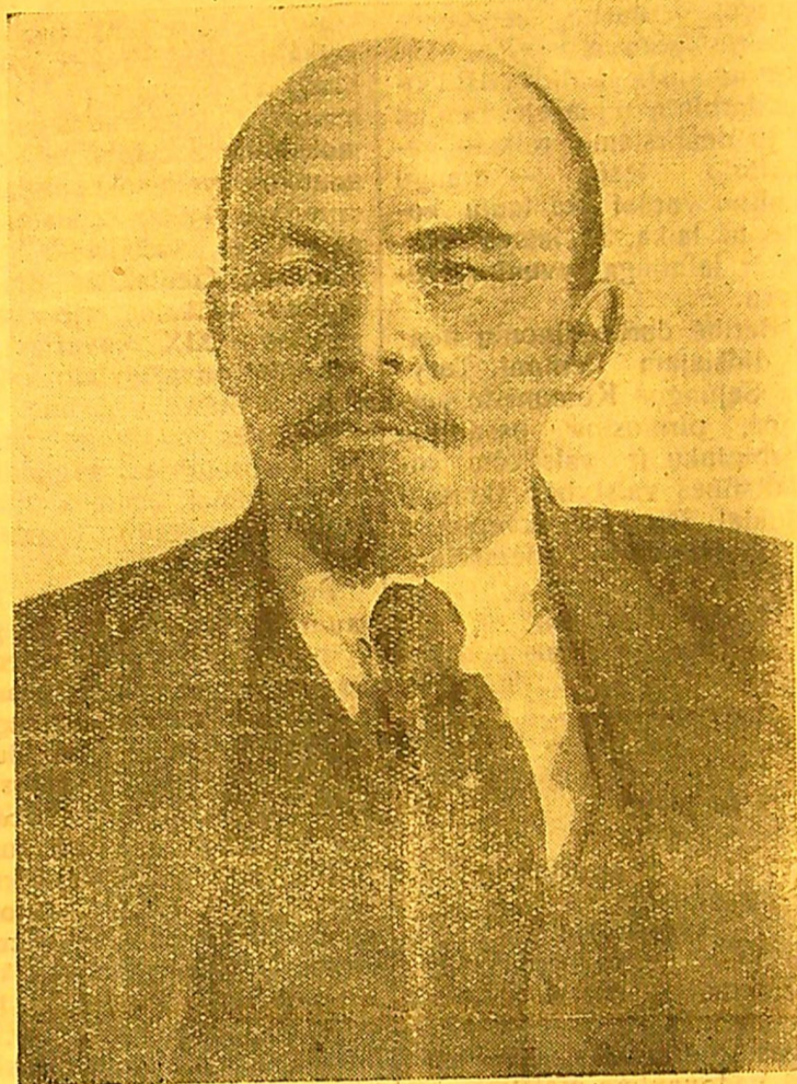
V. I. LENINAS

Su Lenino vėliava, Stalinui vadovaujant, tarybinė liaudis nugalės kovoje už taiką, už komunizmą.