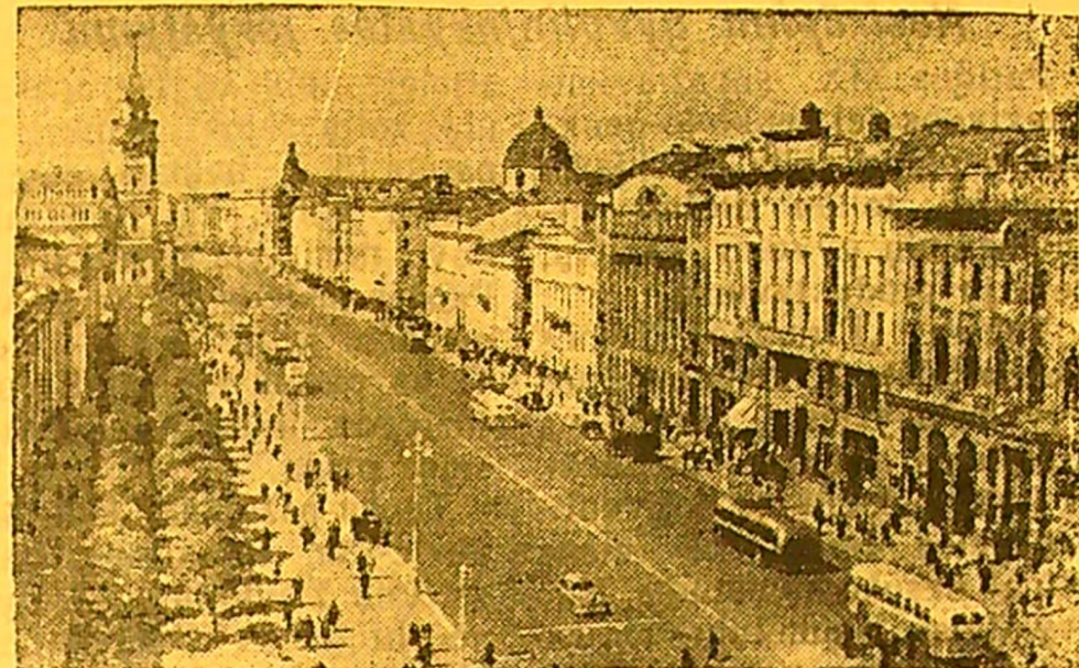
Leningradas. Nevos prospektas.

Visapusiška ir įvairi yra Lietuvos tarybinių rašytojų kūrinių tematika. Šiais metais mūsų respublikos darbo žmonės sulauks apie 50 pavadinimų naujų knygų, kurios praturtins lietuvių tarybinę literatūrą, įneš žymų indėlį į bendrą TSRS tautų kultūros išvystymą.