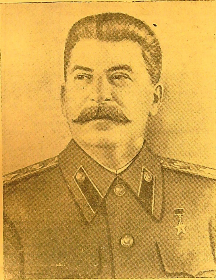
J. V. STALINAS

Visi į rinkimus! Vieningai atiduosime savo balsus už stalininio komunistų ir nepartinių bloko kandidatus.