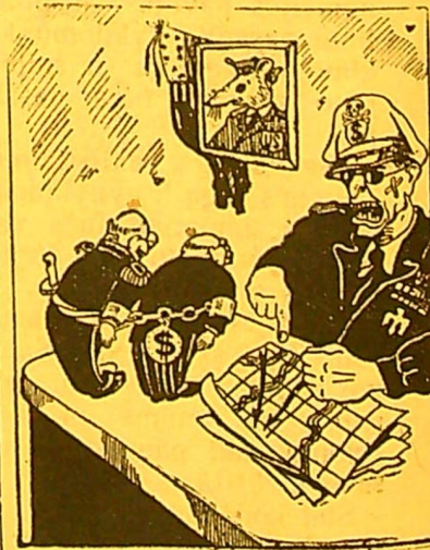
Šeiminnikas ir jo tarnai. V. Ostrovenco piešinys