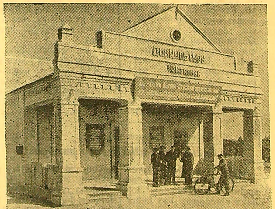
ZAPOROŽJĖS SRITIS. Melitopolio rajono Terpenjės kaime, kur įsikūręs Stalino vardo kolūkis, atidaryti Kultūros namai. Juose įrengta 500 vietų žiūrovų salė, biblioteka.

A. L a m a n a u s k a s „Tarybų Lietuvos“ kolūkio klubo-skaityklos vedėjas