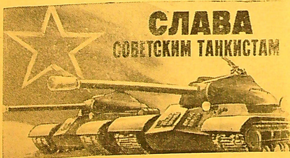
Dailininko V. Viktorovo plakatas, išleistas „Iskusstvo“ leidyklos.