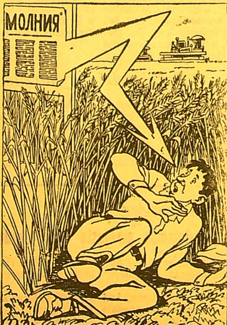
Žaibas giedrą dieną

Kolūkių sienlaikraščių redkolegijos laukų darbuose praktikuoja išleidimą „žaibę“, greitai reaguojančių į visus trūkumus ir darbo pažeidimus.