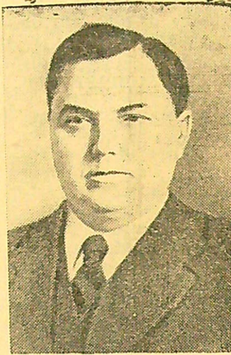
Georgijus Maksimilianovičius MALENKOVAS—VKP(b) CK sekretorius ir Politbiuro narys, TSRS Ministrų Tarybos Pirmininko pavaduotojas.

Gerai paruošti naujus žemdirbystės ir gyvulininkystės meistrų kadrus—reiškia dar sėkmingiau kovoti už tolesnį kolūkių pakėlimą ir jų organizacinį—ūkinį stiprinimą.