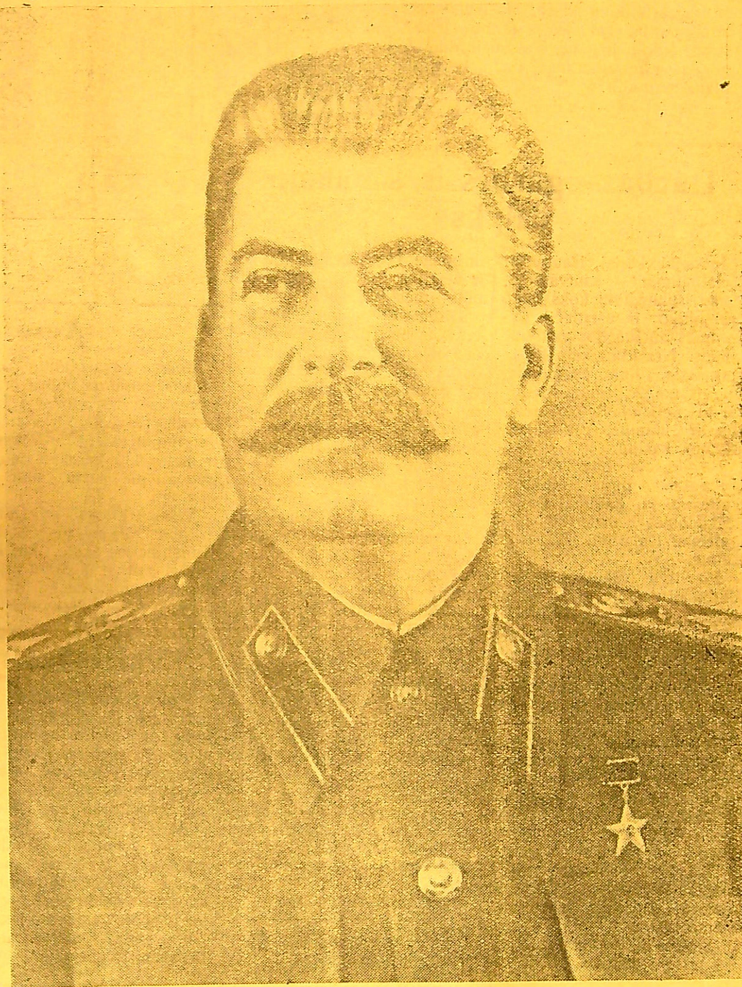
J. V. STALINAS

Su Stalino Konstitucijos vėliava tarybinė liaudis, glaudžiai susitelkusi apie Lenino Stalino partiją, žengia į naujus didingus laimėjimus komunizmo statyboje. Mūsų liaudies taikios statybos laimėjimai yra svarbiausias indėlis į tarptautinės taikos užtikrinimo reikalą ir laidas, kad demokratijos ir socializmo jėgos nugalės visame pasaulyje.