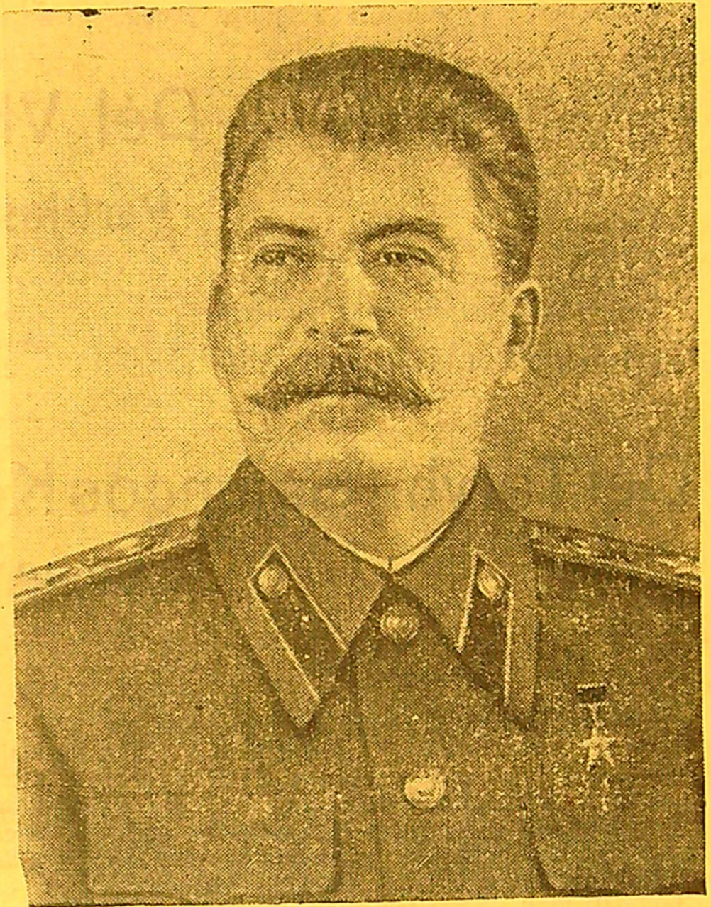
J. V. STALINAS

Anksčiau buržuazija buvo laikoma nacijos galva, ji gindavo nacijos teises ir ne-priklausomybę, statydamą jas „aukščiau už viską“. Dabar „nacionalinio principo“ ir pėdsako neliko. Dabar bur-žuazija pardavinėja nacijos teises ir nepriklausomybę už dolerius. Nacionalinės nepri-klausomybės ir nacionalinio suverenumo vėliava išmesta už borto. Nėra abejonės, kad šią vėliavą teks pakelti jums, komunistinių ir demo-kratinių partijų atstovams, ir nunešti ją pirmyn, jeigu no-rite būti savo šalies patrio-tais, jeigu norite tapti vado-vaujančia nacijos jėga. Nėra daugiau kam ją pakelti. (Aud-tingi plojimai).