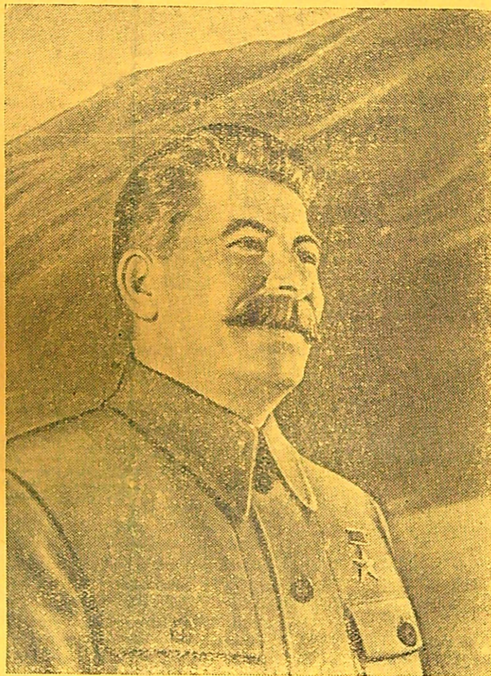
J. V. STALINAS

Šiandieną mūsų šalies miestuose ir kaimuose milijonai tarybinių žmonių išeis į šventines demonstracijas, kad parodyti savo atsitikimus kūrybiniame darbe. Po Lenino vėliava, draugo Stalino vadovaujama tarybinė liaudies tvirtai žengia pirmyn, į komunizmą.