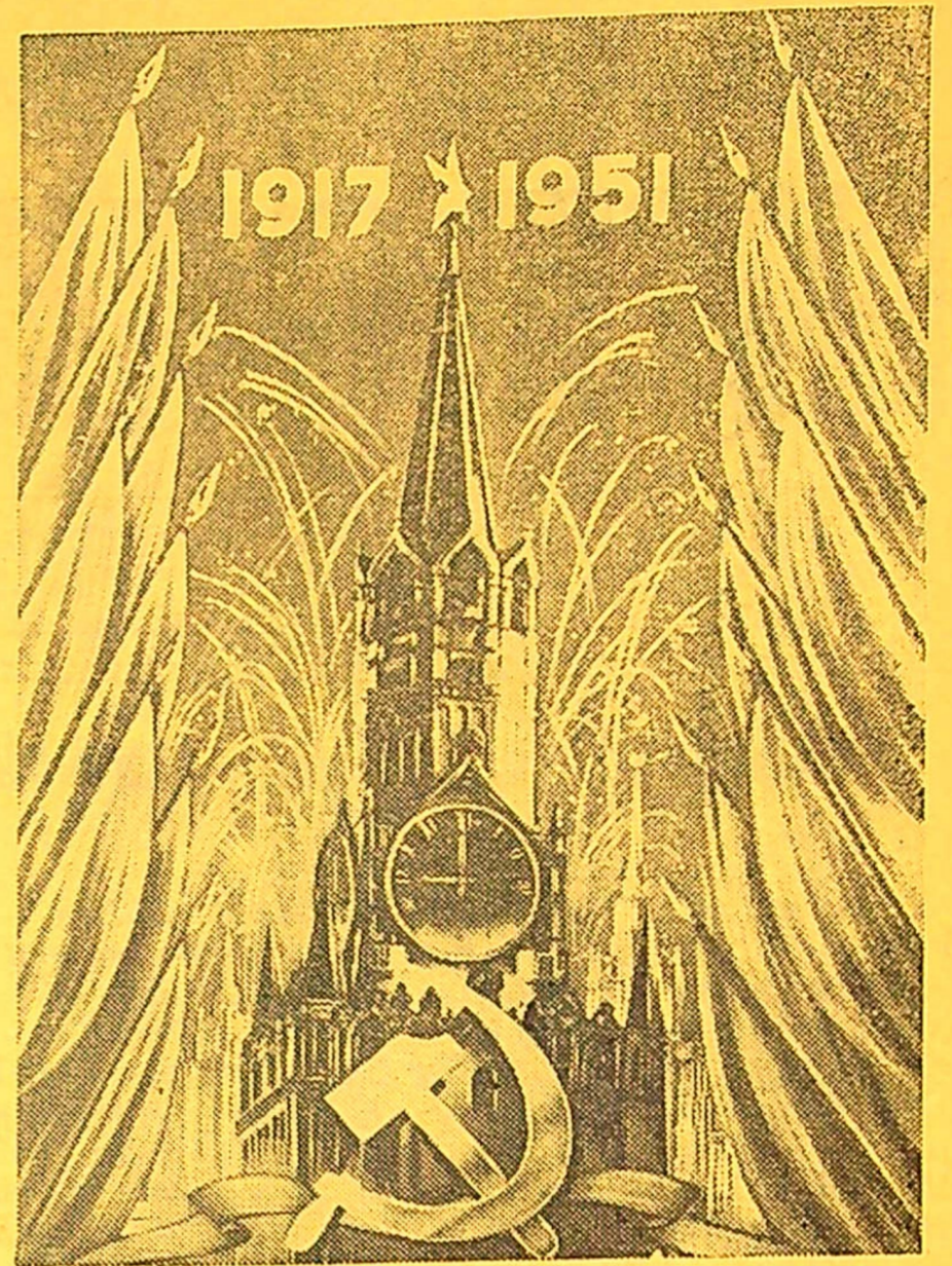
Tegyvuoja mūsų didžioji Tarybinė Tėvynė! Plakatas dailininko V. Viktorovo.

Partinių ir tarybinių organizacijų pareiga dar plačiau išvystyti masinį—politinį darbą kolūkiečių, žemės ūkio mechanizatorių ir specialistų tarpe, išvystyti masinį socialtyniavimą už sėkmingą ir savalaikį visų partijos ir vyriausybės statomų uždavinių įvykdymą.