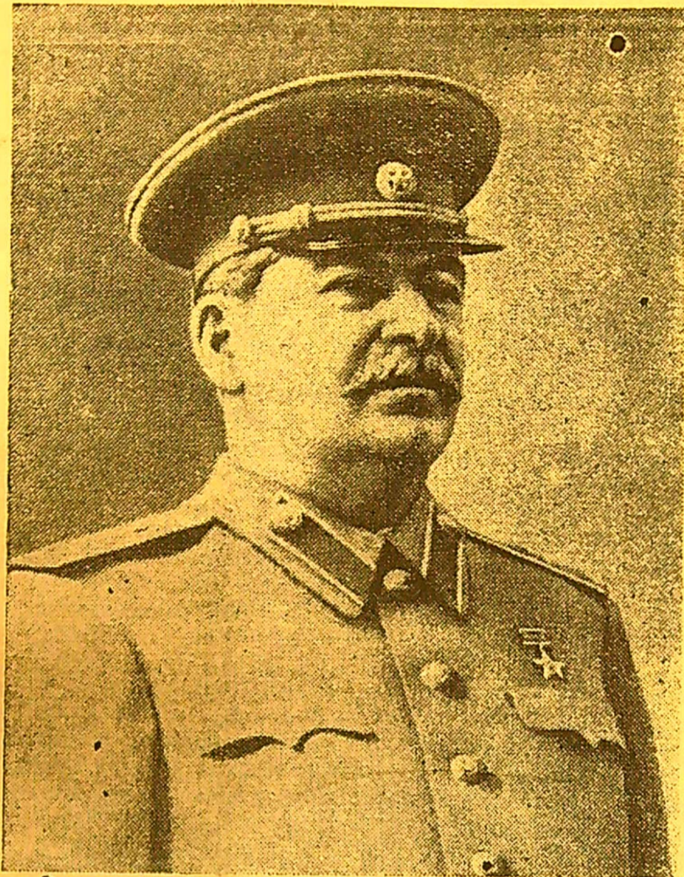
J. V. STALINAS

Atžymėdami Pergalės dieną, tarybiniai žmonės, Lenino Stalino partijos vadovaujami, savo pasiaukojamu darbu dar labiau stiprina tarybinės valstybės—taikos visame pasaulyje tvirtovės—galį.