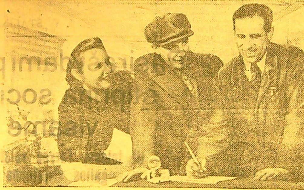
VISI KAIP VIENAS PASIRAŠYSIM NAUJĄ PASKOLĄ!