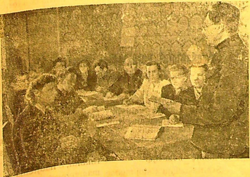
Leningrado sritis. Partinio švietimo tinkle srityje vyksta mokslo metai. Kaimų partinėse organizacijose veikia virš 2000 ratelių ir politmokyklų.

Žemės ūkio skyriaus vyr. buhalteris - instruktorius