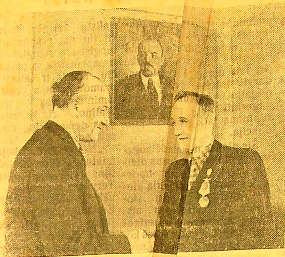
Už žemės ūkio pirmūnų pamo kleidimą