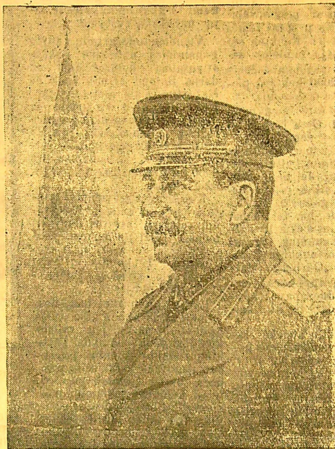
Josifas Visarionovičius Stalinas

Po Lenino vėliava, drau-go Stalino vadovaujami mes užtikrinam žengiam į komunizmo pergalę.