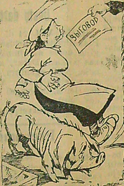
Kaip dirbsi, tokį ir atplėda gausi.

Fermos vedėja visai nesirūpina gyvulių aprūpinimu koncentruotais pašarais ir pakratomis.