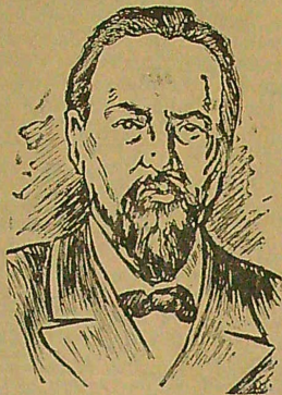
A.S. Popovas — radijo išradėjas

Nuo pirmųjų Didžiosios Spalio socialistinės revoliucijos