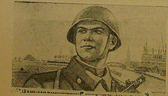
Mes turime ginti mūsų taikų darbą. Paskola sustiprins šalies gynybą

Naujoji paskola, kaip ir visos mūsų paskolos, skirta toliau išvystyti šalies liaudies ūkį, tarybinį mokslą ir kultūrą, — pasakė jis. — Kiekvienas mūsų didžiuojasi tuo, kad jis dalyvauja socialistinėje statyboje. Mes su džiaugsmu duosime savo santaupas šaliai toliau išvystyti.