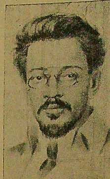
Spalio dienomis jis buvo išrinktas į Partinį centrą, vadovaujama drau-

(65-osioms metinėms nuo gimimo dienos—1885 m. birželio 4 d.)