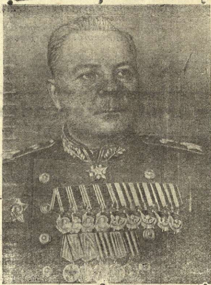
Tarybų Sąjungos Marsalas K. E. Vorosiļovas