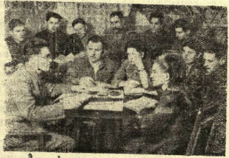
Chabarovskio sritis. Priešakinis Kupianskio rajone Teilmano vardo kolektyvinis ūkis. Čia pastatytas naujas klubas, kuriame dirba keletą ratelių. Yra biblioteka—skaitykla.