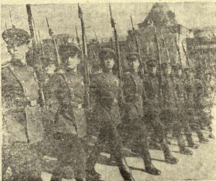
1948 m. GEGUŽĖS 1 ŠVENTĖ MASKVOJE

Maskvos gėrnizono paradas. Rau lonojoj aikštėj. Nuotraukoje: Karo mokyklų kursantai parade.